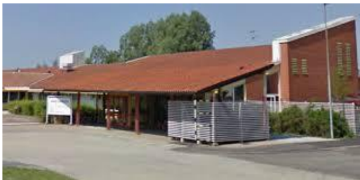
Annegården, Skansvägen 5

Har du ny e-postadress? Skicka ett mejl till lund@hrf.se , så lägger vi in din nya adress! Vi tar tacksamt emot förslag på aktiviteter från er medlemmar. Mejla oss gärna om det är något speciellt som ni önskar i programmet.