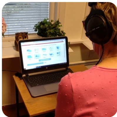
Hörselskadades dag i Motala - Test av hörsel med hjälp av Hörselestaren.

Hörselskadades dag 11/10 var välbesökt med många som ville testa sin hörsel med hjälp av Hörselestaren. En lyckad dag där besökarnas bjöds på förtäring och fick träffa oss som jobbar i föreningen. Några nya medlemmar registrerades tacksamt.