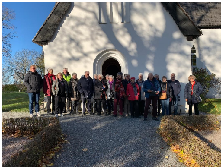
Bild utanför Härkeberga kyrka