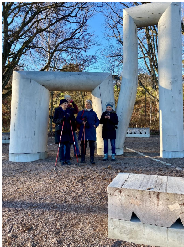
Bild från stavgången till Ulleråker 12 nov

Väl inne i den rymliga lägenhetens välkomnande värme bjöd hon oss småfrusna kvällsflanörer på ångande varm glögg, pepparkakor och ädelost. Tillsammans runt det stora antika bordet satt vi och hade det väldigt trevligt och småpratade med varandra om intressanta saker. Det var så många upplevelser vi hade att berätta om.