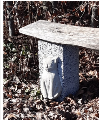
Har du sett de fina katterna som finns på en av bänkarna längs Åpromenaden?

Anmäl intresse till kansliet , så kontaktar vi er om det blir aktuellt med utflykt eller fika.