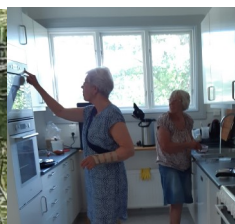
HRF har ett arbetspass på Sommarro