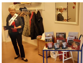
Så här såg det ut förra året, då vi var på Villa Sandgatan.