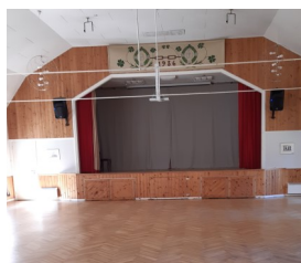
Samlingssalar i Boglösa byggd 1936, och Litslena 1937

Under sommaren har vi hunnit med att besöka sex bygdegårdar för att informera om möjligheten att söka bidrag från Boverket för att installera teleslinga. Ett generationsskifte verkar ha skett i många av föreningarna för många av de vi träffade var yngre entusiaster som tagit nya tag i verksamheten. Alla har varit mycket tacksam över informationen, och nu hoppas vi de söker bidraget och kan installera slingor innan nästa sommar.