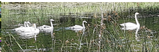
Sångsvanar i Vattenparken