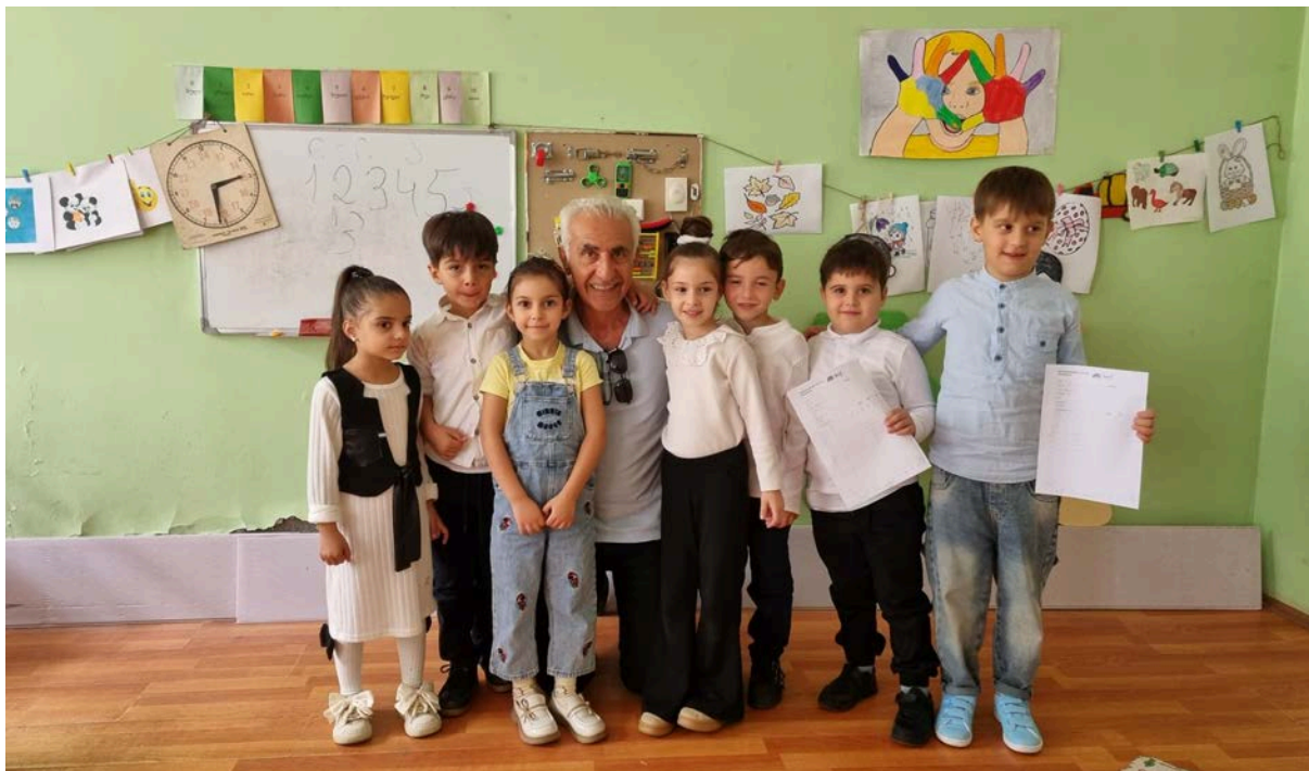
Zugdidi i Georgien

Projektet har redan fått en preliminär förfrågan om att besöka Khachori våren 2025 och där utföra tester på ca 2500 skolbarn. En ansökan för två resor under 2025 har lämnats in till Hörselskadades riksförbund och Barn i hjärtat/Tolvskillingshjälpen.