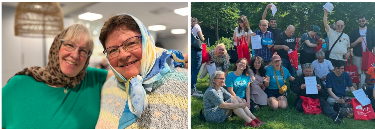
Bilder: Påskfirande under öppet hus och Vad sa-loppet i Tantolunden

Under Vad sa-loppet, årlig kampanj på förbundets initiativ under maj månad, ordnade föreningen en dag i Tantolunden. Under dagen fick vi till samtal kring viktiga frågor om tillgänglighet och rättigheter för personer med hörselskada. Under dagen fick vi sällskap av flera samarbetspartners som Vux Huddinge, Teater Hipp-Happ, HRF:s tidning Auris, och HiSUS/UHiS.