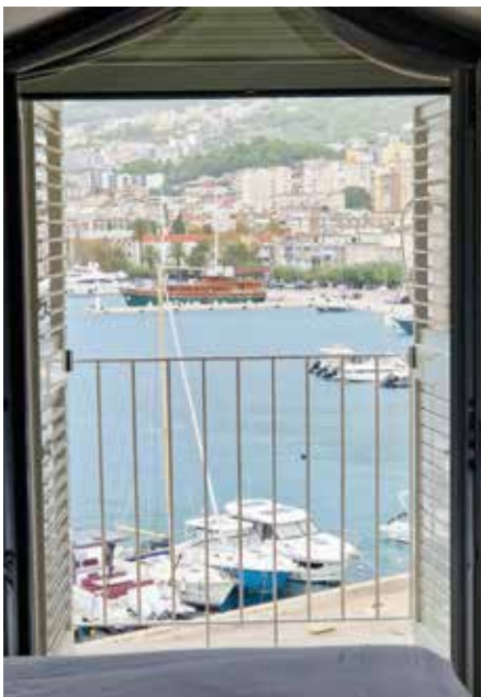
Många av rummen på Hotel Osejava hade utsikt mot bukten och den lilla staden Makarska.