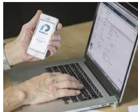
Många funktioner i dagens samhälle förutsätter att man har BankID.

Begripsam AB har som mission att göra samhället mer tillgängligt. Begripsams mål är att samhället ska begripa att människor är olika, med olika behov. Samhället ska vara begripligt för alla människor. De vill påverka alla som utvecklar tjänster, tar fram information eller skapar standarder.