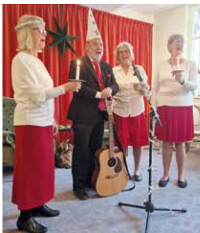
Vår egen huskör dyker upp på Öppet hus-jul festen och bjuder på julstämning med välkända julsånger.