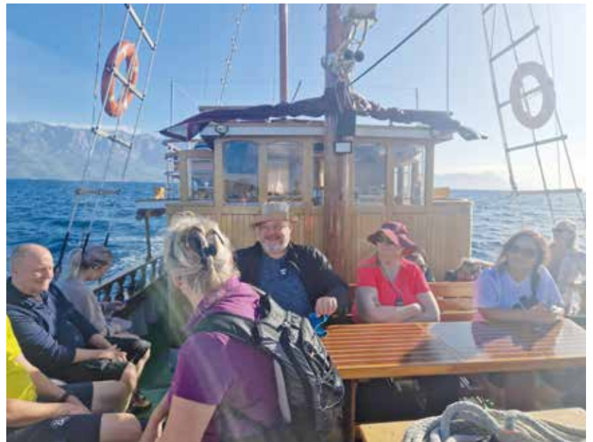
Ena dagen vandrade vi på ön Brac dit vi tog oss med båt.