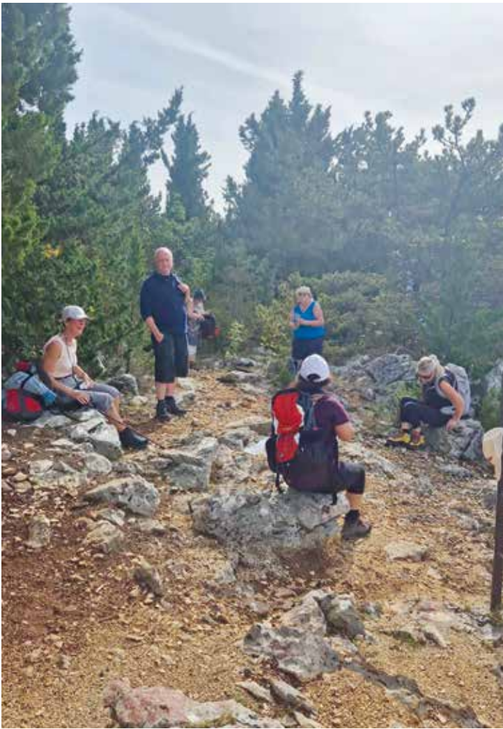
Pauser behöves i det steniga landskapet där man bitvis verkligen fick se efter var man satte fötterna.