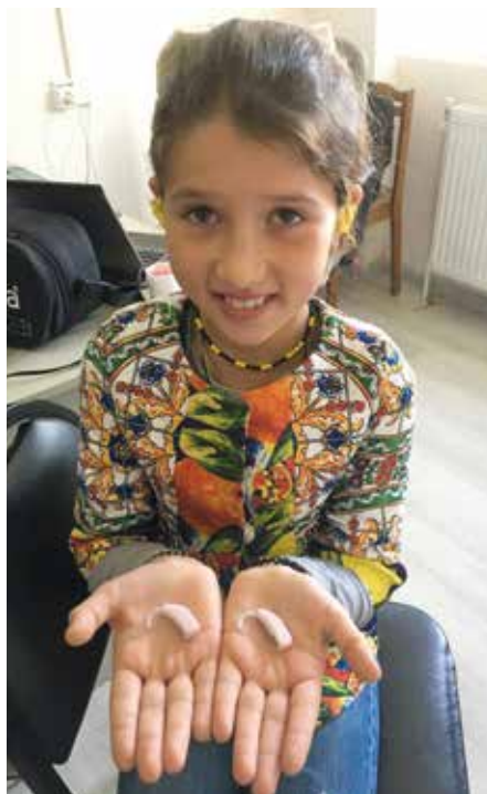
Ett av de 48 barn som fick hörapparater och chans till ett bättre liv.