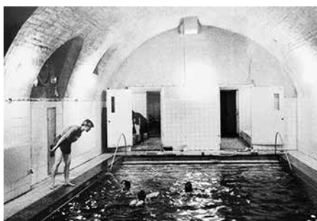
Badet låg nere i källaren under vackra källarvalv.

Avslutningen i skolan i juni månad var gemensam för alla klasser i skolan. Då tågade vi längs med Svartmannagatan med svenska fanan främst i tåget mot Storkyrkan för avslutningsceremonin inför sommaren. Kyrkan