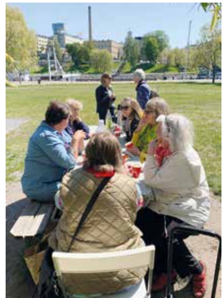
När vädret är fint är det skönt i parken nere vid Hammarbykanalen, ett par hundra meter från lokalen på Malmgårdsvägen 63.

Håll koll på medlemsbrev i e-posten, på facebook och i kalendern på hemsidan var vi träffas och vad det är för program på våra träffar. Är du osäker kan du alltid höra av dig till kansliet.