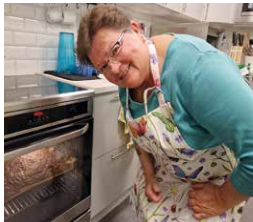
Mayvor Gammals bakad fika-bröd till alla årsmötesdeltagare.

Styrelse och personal tackar de engagerade medlemmarna i vår förening.