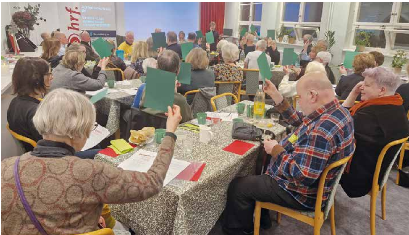
Ett enigt årsmöte gav styrelsen förnyat förtroende