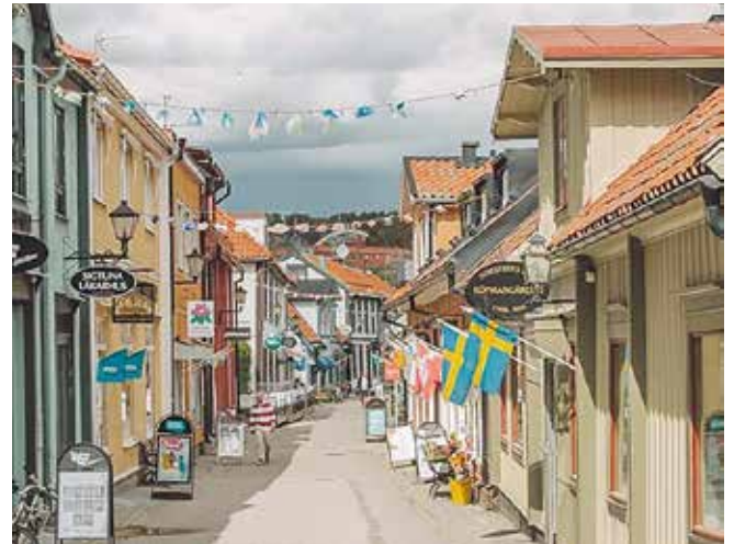
Sigtuna är en av landets äldsta städer.