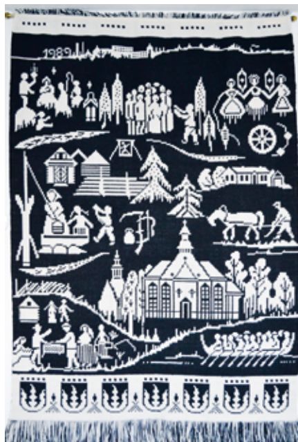
Exempel på en finländsk täkänäbonad eller finnväv som de kallas här.

Finland är känt för sin design inom olika hantverksområden. Själv kom jag i kontakt med den genom min svärmor, som när hon blev änka på 1960-talet tog kontakt med ett finländskt väveri. Hon hade alltid tyckt om textilier och sydde själv sina kläder. Det gjorde faktiskt jag också på den tiden, bland annat genom den kurs som i några år pågick i hörsel föreningen då den höll