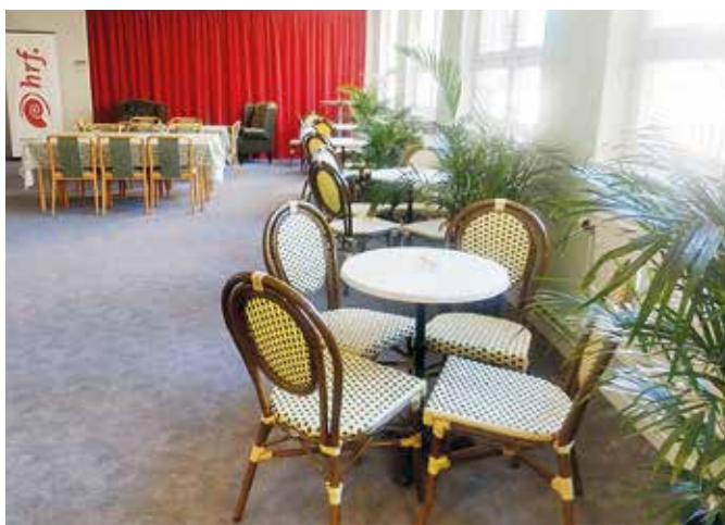
Föreningslokalen står tom och öde i väntan på bättre tider.

om du behöver hjälp att handla, installera något, beställa hörapparatsbatterier eller hitta information till exempel. Eller om du bara vill prata med någon.