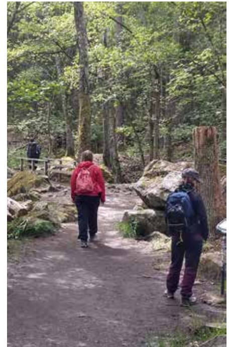
Judarskogen är ljuvlig i försommartid.