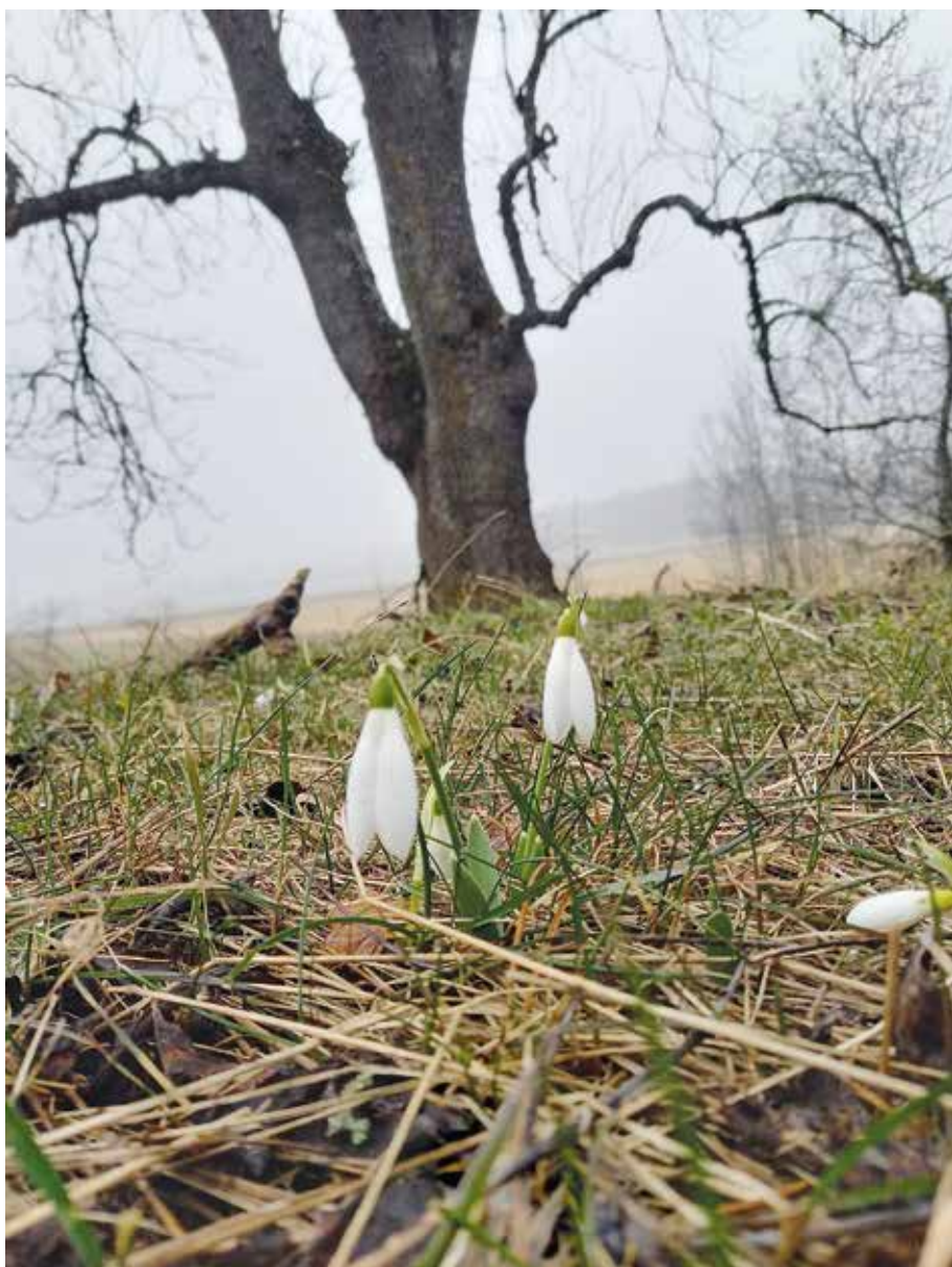
Först ut är snödropparna. Denna fina bild är fotad av Elin Träff vid gravkullen i Tumbo, Eskilstuna.