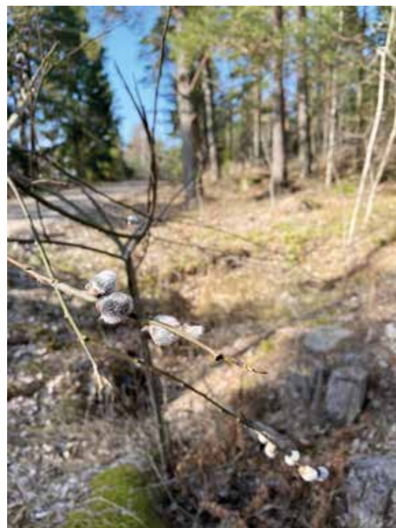
Videkissarna har vaknat och då är det vår! Agneta Österman Lindquist har fotat den fina bilden.