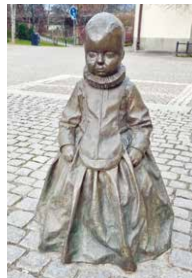
"In Waiting" av Charlotte Gyllenhammar.

Hon är så liten, står där utsatt för väder och vind och folks medlidssamma blickar. I vintras klädde någon henne i både mössa och halsduk. Ja, man vill täcka det lilla kala huvudet med något. "Du blir ju sjuk lilla vän. Öroninfektion."