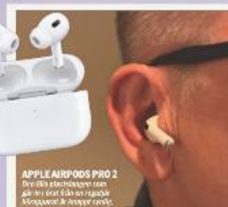
APPLE AIRPODS PRO 2 Den nya sladdlösa hörluren som är en stor förändring för hörselburen.

De finns olika typer av hörlurar. De vanligaste är "bakom örat", eller BTE (Behind the ear), och "in i örat", eller ITE (In the ear). BTE hörlurar är ofta större och har en tydligare ljudprofil. ITE hörlurar är ofta mindre och har en mer diskret design. Det finns också "hörnär" som är hörlurar som sitter i örat. De finns också "hörnär" som är hörlurar som sitter i örat. De finns också "hörnär" som är hörlurar som sitter i örat.