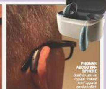
PHONAK AUDEO I90-SPHERE Bäst i klassen för hörselburen som är en stor förändring för hörselburen.

Det finns också olika typer av hörlurar. De vanligaste är "bakom örat", eller BTE (Behind the ear), och "in i örat", eller ITE (In the ear). BTE hörlurar är ofta större och har en tydligare ljudprofil. ITE hörlurar är ofta mindre och har en mer diskret design. Det finns också "hörnär" som är hörlurar som sitter i örat. De finns också "hörnär" som är hörlurar som sitter i örat.