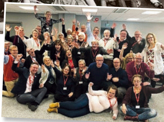
HRFs förbundsmöte 2018.

Vill du starta en förening? Det är enkelt! Läs mer på: hrf.se/starta-en-forening