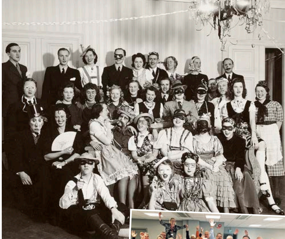
Maskeradbal på Dövas Vål, 1942.

Ring: 0771-888 000, vardagar Skriv: hørsellinjen.se/mejla