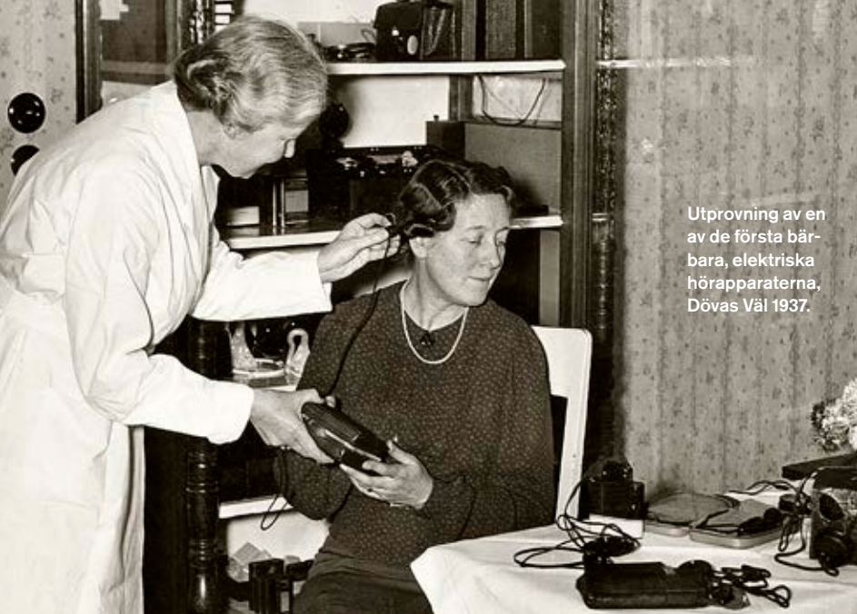
Utprovning av en av de första bärbara, elektriska hörapparaterna, Dövas Vål 1937.