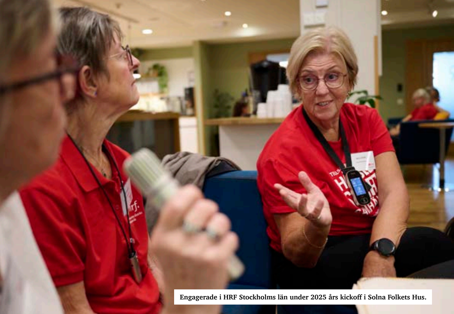
Engagerade i HRF Stockholms län under 2025 års kickoff i Solna Folkets Hus.