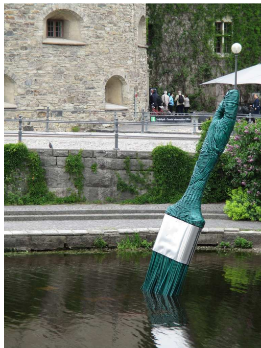
Open Art framför slottet år 2015.

Anmälan senast 7 augusti till kansliet via e-post hrf-t-lan@bahnhof.se , telefon 019-673 21 60 eller 0738 52 16 14 (även sms).