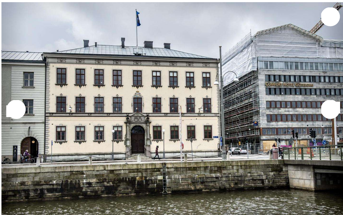
Länsmiddagarna tar plats i residenset i Göteborg.