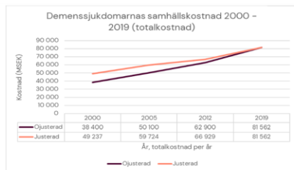
Figur 4. Demenssjukdomarnas samhällskostnad 2000 – 2019 (totalkostnad).