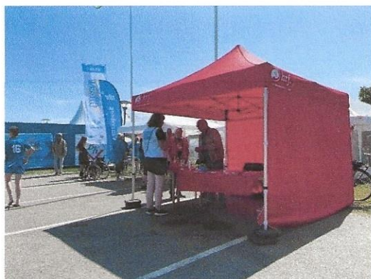
Aqua Blå 3 juni

Vår verksamhet för våren är nu över och avslutades med vår medverkan på Aqua Blå den 3 juni i Vänersborg. Vi är för närvarande 121 medlemmar.